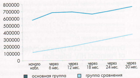
Рисунок 2. Динамика вирусной нагрузки у детей в зависимости от путей инфицирования

Дальнейший хронологический анализ показателя CD4 лимфоцитов показал, что скорость снижения данной